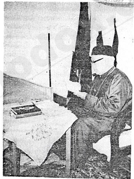
ብዑስ ፡ አቡነ ፡ ራሌደስ ፡ በሱባዔ ፡ ውስጥ ።